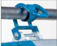
足場パイプ用フック (オプション)